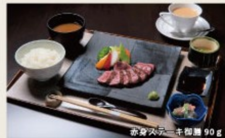
赤身ステーキ御膳 90g